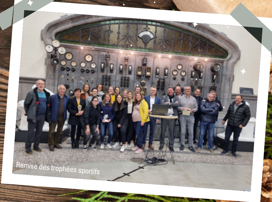
Remise des trophées sportifs