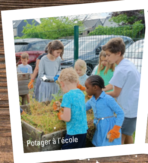
Potager à l'école