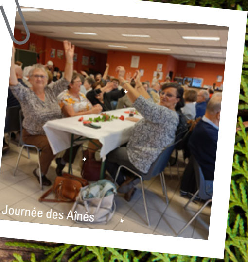
Journée des Aînés

Retrouvez notre vidéo sur www.sprimont.be