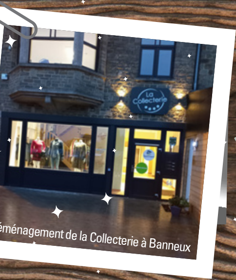
Aménagement de la Collecterie à Banneux